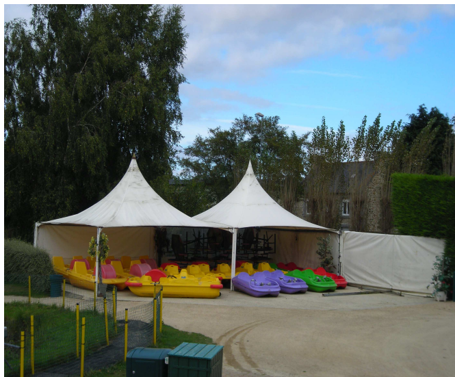
Structures existantes à remplacer